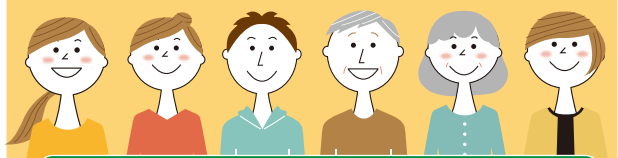
6人以上で開催 2セット

3 大人5人までは1セット、 6人以上で2セットご注文できます。 ※2セットの場合、組み合わせは自由です。