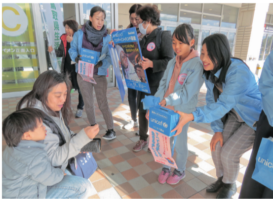
鳥取県生協の組合員さんで行った募金活動の様子

支援しなければならない子どもたちが健康で笑顔になり、ユニセフの存在が必要なくなることを目標に活動しています。5歳未満の子どもが1000人中50人以上亡くなっている国はまだ多く、SDGsの目標とされている25人以下にはまだまだ遠いと感じます。干ばつや水害、紛争、感染症と問題は尽きず、支援先も増えています。また、子どもは「子どもの権利条約」で守られていることを、子どもたち自身に知ってほしいです。その子どもたちが大人になった時に、子どもたちを守る大人になってほしいと思います。