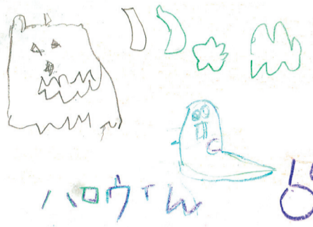
鳥取市 きらきらさん

「産直市」です。鳥取県は、食のみやこと言われるだけあり、農産物も海産物もすべて美味しいです。それは大山の美味しい水があるからと。日吉津アスパル、JAはま、琴浦や大西の道の駅は、特に大好きです。米子市和田にあるしんちゃん農園も新鮮野菜があり、行くのが楽しみです。