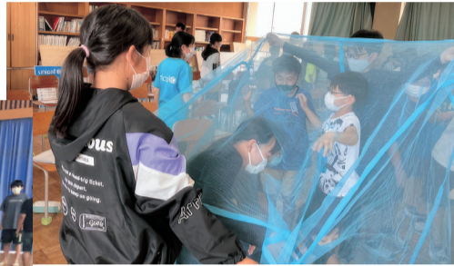
県内の小学校で行った出前授業の様子

鳥取県ユニセフ協会では、主に「募金活動」や「啓発活動」に取り組んでいます。募金活動では、通常募金や緊急募金、外国コイン募金などに取り組んでいます。啓発活動では、鳥取県内の学校での出前授業や一般団体に向けての学習会、パネル展、情報発信なども行っています。