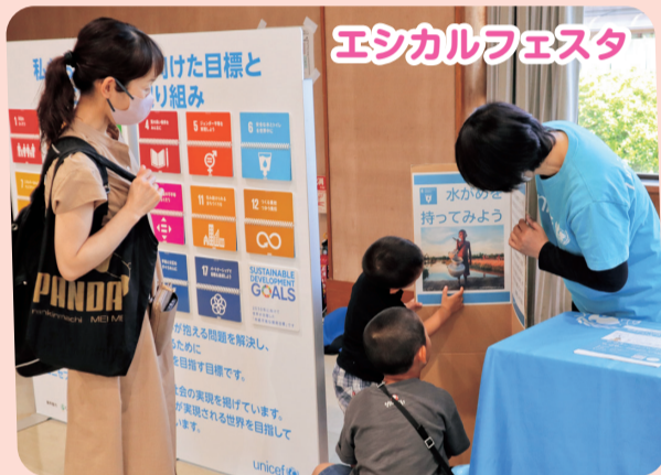
エシカルフェスタ

各エリアで行っている組合員活動でも、組合員さんと一緒にユニセフ活動について学んだり、取り組んでいます。学習会やハンド・イン・ハンド募金、組合員さんを対象とした出前授業も行っており、児童労働や子どもの権利条約などについて、子どもの権利を守ることを理念として活動しているユニセフのことを伝えています。