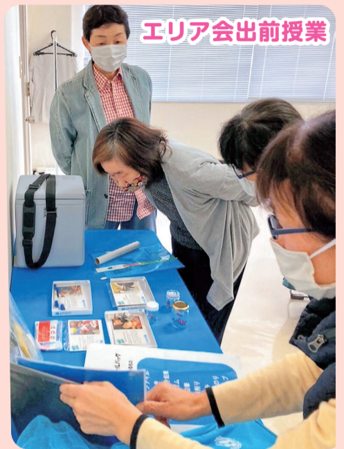
エリア会出前授業

鳥取県ユニセフ協会による出前授業のようす。 実際に使用する栄養治療食や蚊帳などを 手に取ったり、体験したりできます。