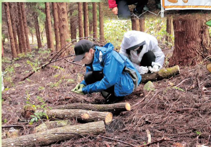
しいたけの植菌のようす