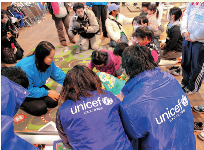
東日本大震災支援のようす