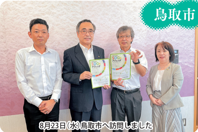
8月23日(水)鳥取市へ訪問しました