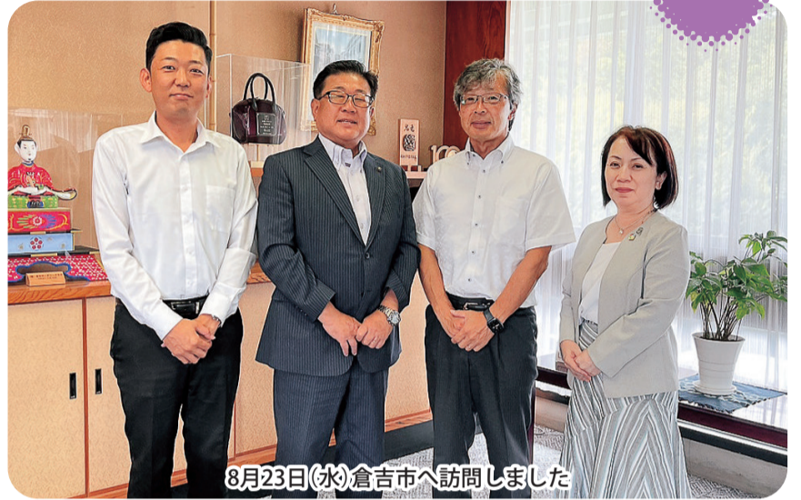
8月23日(水)倉吉市へ訪問しました