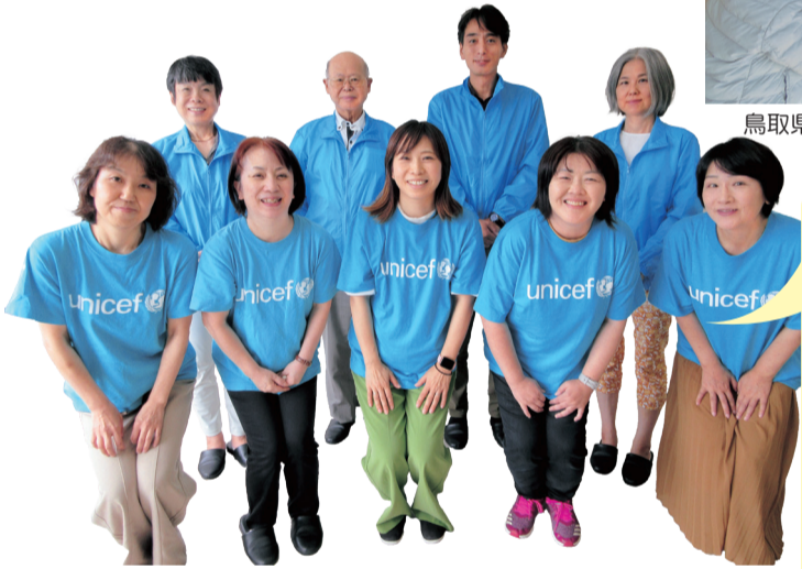
鳥取県ユニセフ協会の皆さん