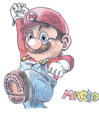
米子市 まゆばあばさん

りに近づいている様です。このまま行くと、本当に地球はどうなってしまうのでしょうか。残された寿命が残り少なくなってきたのに地球のことが心配です。若い方々にお願います。「青い地球を守ってください。」